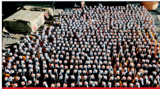
स्कार्पियों में मिली 165 लीटर जल्ट हुई थी शराब

मारकर एक्सीडेंट कर दिया, जिसमें 2 की मौत हो गई थी और अन्य कई घायल हो गए थे। कांकेर पुलिस ने शराब वाहन को चला रहे वाहन चालक एवं उसके साथी एवं इन दोनों को शराब की डिलेवरी की जगह बताने वाले नाबालिग मास्टरमाईड को दबोच लिया। पुलिस ने बालिग दो आरोपियों को जेल